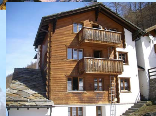
Unser Freizeithaus „Mischabelblick“